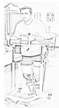
Integração na atividade da pessoa com amputação/Produtos de apoio

1ªs Jornadas Transdisciplinares em Amputados do Membro Inferior(GIFPA) Fevereiro 2015