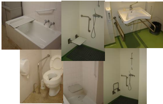
Integração na atividade da pessoa com amputação/Produtos de apoio